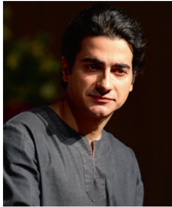
Homayoun Shajarian Singer (Soloist)